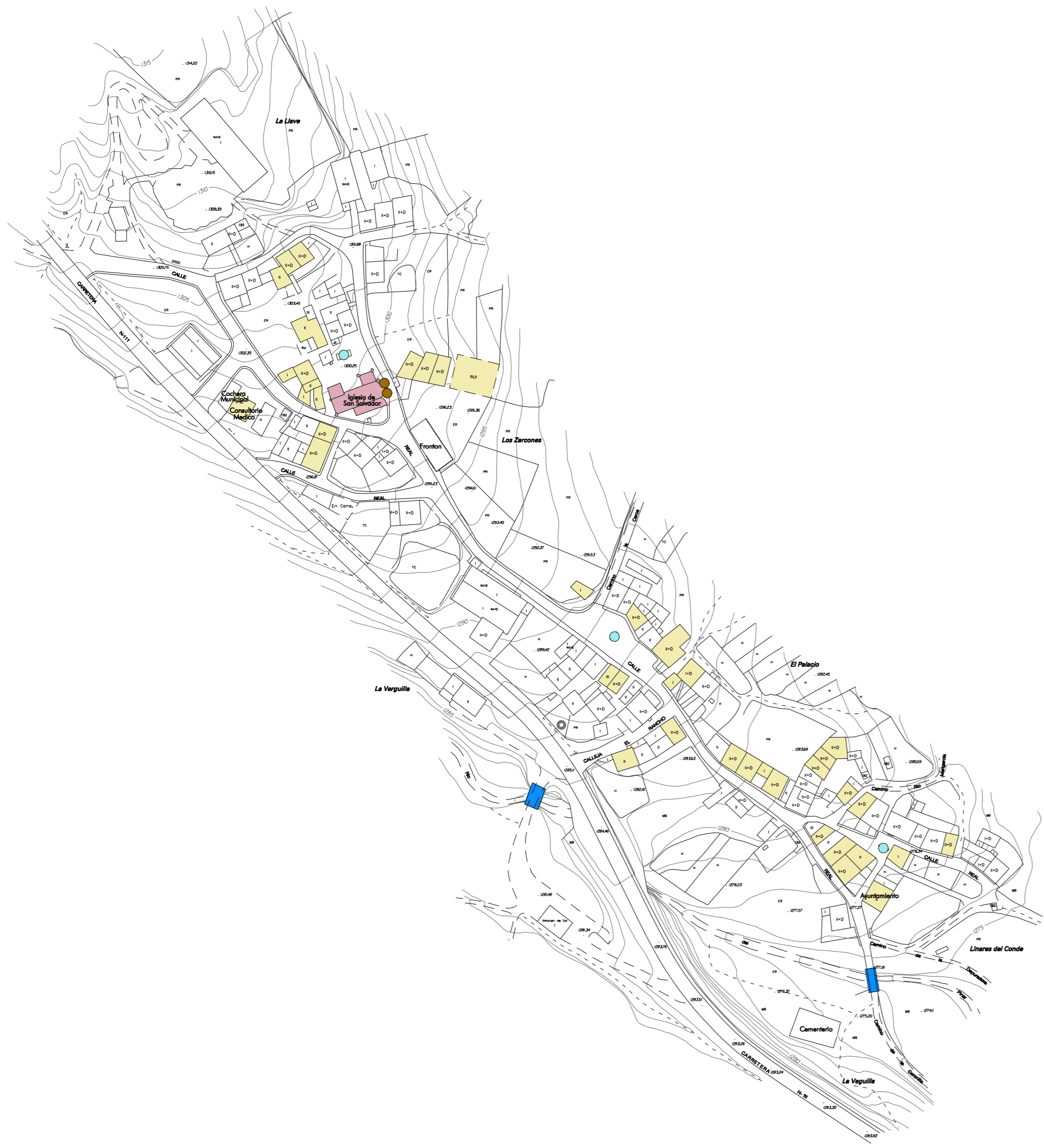
LA POVEDA DE SORIA