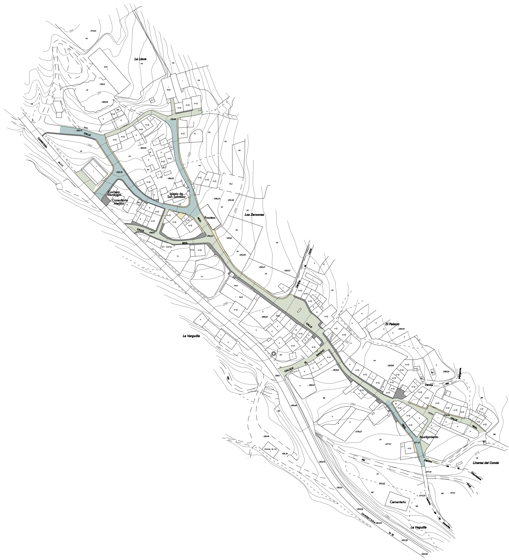
LA POVEDA DE SORIA